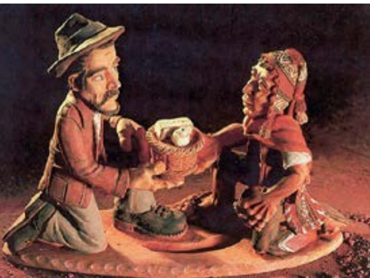
Tonplastik: Raúl Castro

Es lässt sich nicht feststellen, wer gibt und wer empfängt. Beide sind Partner, die einander nicht nur den Korb mit den Gaben reichen, sondern sich selbst. Wer nimmt, empfängt mit der Gabe auch den Geber. Schenken und Empfangen werden eins. Im Austausch wächst Partnerschaft – ein gegenseitig bereicherndes Geben und Empfangen.